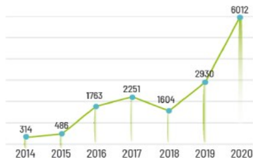
Giudizio generale dei partecipanti ai webinar eTwinning