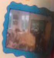
Miss D'Amico (Turin) and Miss Spronk (Rotterdam) with their students from the twinning project.

we loved working together as you can see!